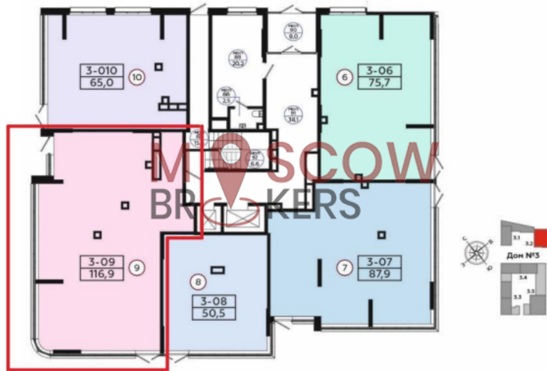
Местоположение Объекта на 1 этаже Жилого дома